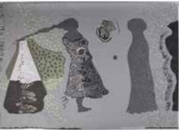
Tudalen / Page 53