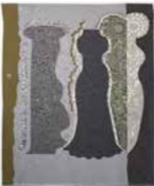
Tudalen / Page 52