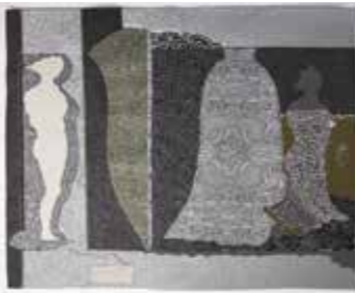
Tudalennau / Pages 48-49