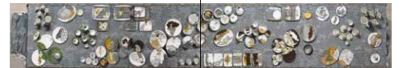
Tudalennau / Pages 42-43