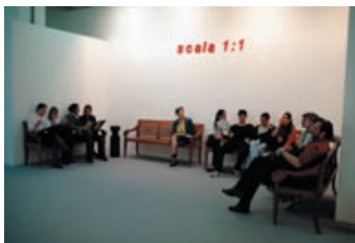
SCALA 1:1, 2001, smalto su ceramica, cm 176 x 25 (fiera di Milano) courtesy galleria Mazzoli.

Una costellazione di frasi in ceramica ricoprirà le pareti, in modo che l'intervento artistico di queste "opere in forma di testo" costituisca un'operazione parallela all'estrapolazione di passi fortemente evocativi tratti dai libri scelti. Un'appropriazione che va a costituire un paesaggio di definizioni in mutamento e crescita. Un intervento, quindi, atto a modificare non soltanto lo spazio fisico (luci, scaffalature, accessori e sedute verranno infatti riprogettati) ma che influisce anche sullo spazio concettuale coinvolgendo non solo il tempo dedicato alla lettura ed il rapporto libro-lettore visto nella mutazione successiva in progetto artistico, ma che prova ad immaginare una biblioteca reale a partire dal punto di osservazione degli artisti stessi.