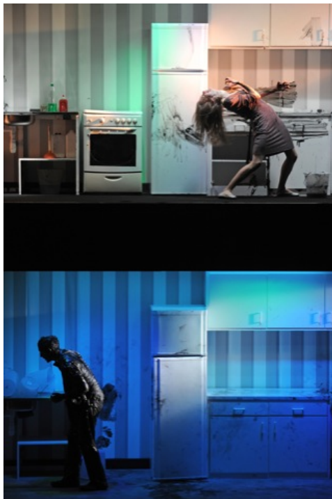
War Sweet War , 2012.

L'ambition de Lambert-wild est, on le voit, de prendre en compte des contraintes réelles mais de les transformer en procédés qui permettent une remise en question profonde des modes de création et de perception. Les « impossibles » physiques de la scène, les contraintes pratiques du plateau, constituent pour Jean Lambert-wild une provocation qu'il s'agit de détourner en usant de procédés techniques qu'il déplace et détourne.