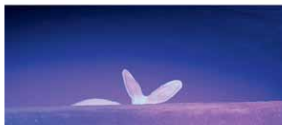
Anne Imhof, Deal , 2015