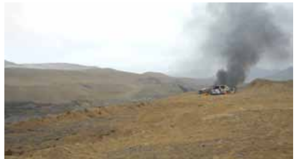
Maya watanabe. scenaries . Basural fotograma / Scenaries (still) (2014). Maya Watanabe

Un des objectifs de Matadero consiste à soutenir la production de nouvelles œuvres artistiques, réalisées à la fois par des artistes locaux et par des artistes internationaux.