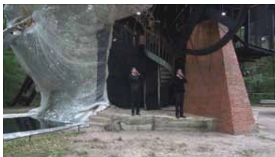
Denis Savary, Etourneaux , 2013. Acquisition en 2014