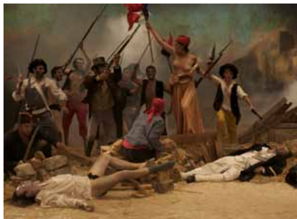
Cristina Lucas, La liberté raisonnée , 2009, Video HD. Cristina Lucas.